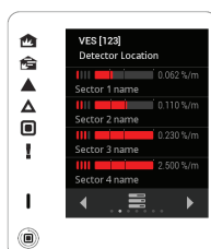
Página de estado de Secciones